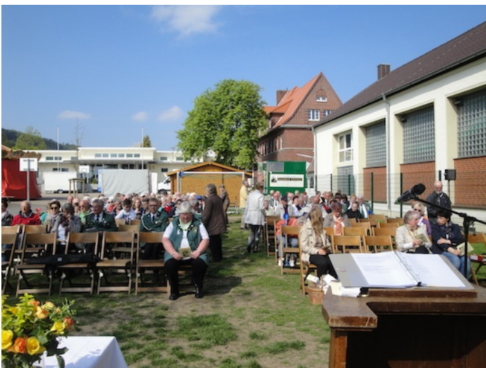
Viele andere aber sind der Einladung gern gefolgt: Festgemeinde auf dem Außengelände der Grundschule Nettelstedt ... ☺